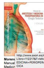
Morenc Manual EdICINA+PERIOPERAT CICA Cirugía Torácica, 2ª Ed